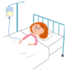
病気で入院したとき、病気で手術したとき 病気で入院後通院したとき