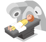
病気で放射線治療を受けたとき