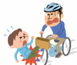
自転車との接触によるケガ