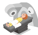
病気で放射線治療を受けたとき