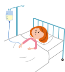
病気で入院したとき、病気で手術したとき 病気で入院後通院したとき