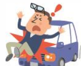
歩行中に自動車にはねられてのケガ